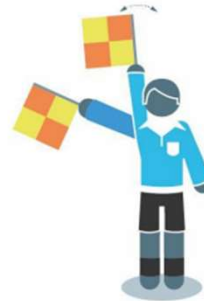
Overtreding van de verdediger