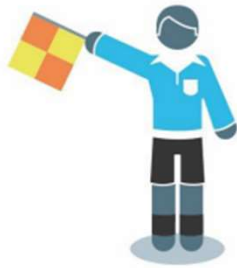
Inworp voor de aanvallende partij