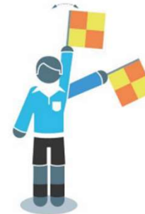
Overtreding van de aanvaller