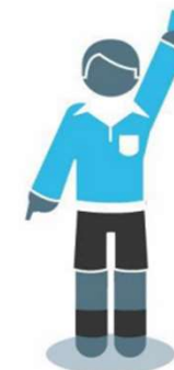
Rode en gele kaarten