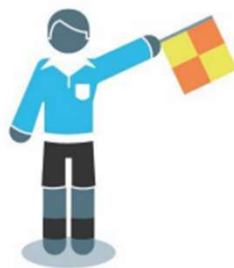
Inworp voor de verdedigende partij