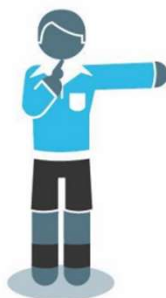
Directe Vrije Schop