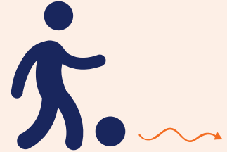
Nieuw Dribbelen, schieten of passen