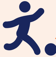
Huidig Schieten of passen